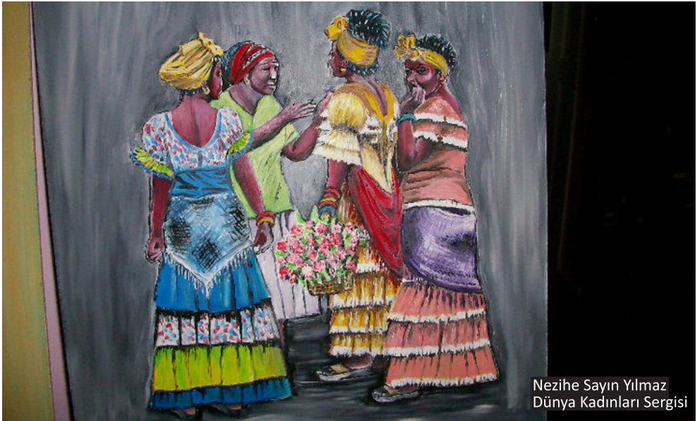
Nezihe Sayın Yılmaz Dünya Kadınları Sergisi

Yaşam evrensel ve insani boyutuyla algılanmıyor, salt bir canlı olmanın ilkelliği olarak sürdürülüyorsa, insan olmanın gereklerinden ve sorumluluklarından uzak kalınıyorsa, orada ölmeden de öldür, insanlar. İçi boş yıllar, bir ömür değil zaman öldürmektir. Gerçek ömür, içi dolu yıllarla ölçülmemeli, en güzeli öldükten sonra da yaşamalı insan değil mi?